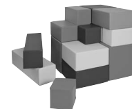
PS 2162 Kostka z pianek