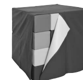
PS 2163 Pokrowiec na kostkę z pianek