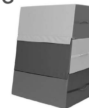
NS0169 Skrzynia gimnastyczna duża