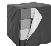
PS 2163 Pokrowiec na kostkę z pianek