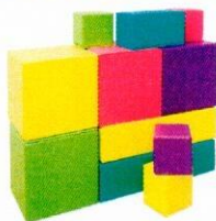
PS2162 Kostka. Zestaw piankowych klocków.