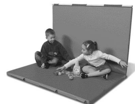
NS 0554: Materace łączone (dwie sztuki) wym. jednego materaca 150 x 100 x 5 cm; po złączeniu powstaje materac 150 x 200 x 5 cm