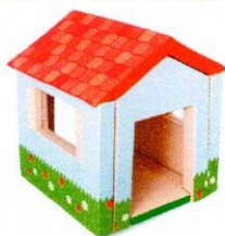
NS2223 Domek piankowy z nadrukiem.