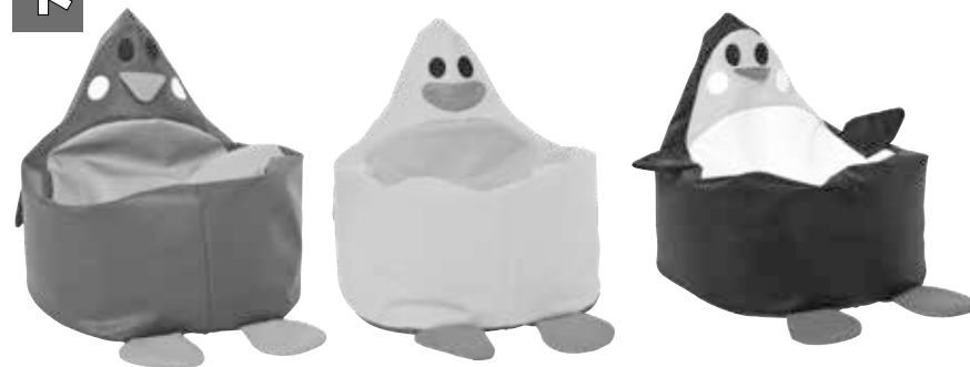
■ NS1985- Pingwin