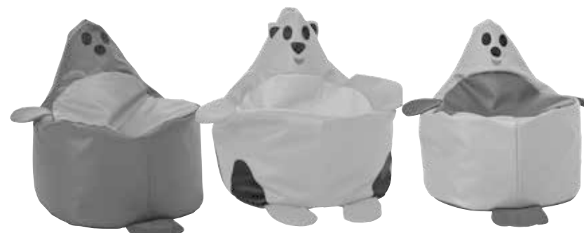
■ NS1988- Foka 1