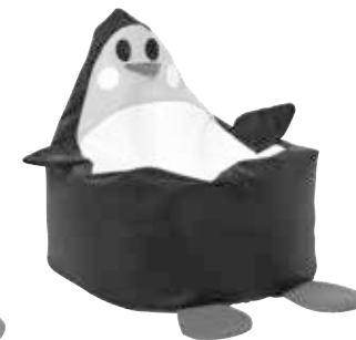
■ NS1987- Czarny Pingwin