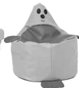
■ NS1990- Foka 2