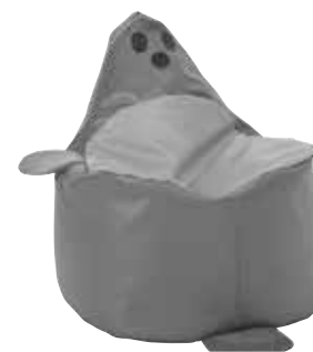
■ NS1988- Foka 1