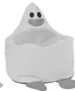
■ NS1986- Kaczuszka