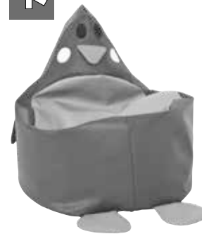
■ NS1985- Pingwin