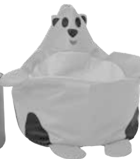
■ NS1989- Tygrys