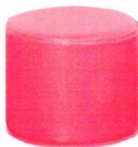
NS1501RO Pufa piankowa 32 cm. Różowa.