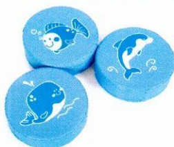
NS0681 Morze. Krążki piankowe.