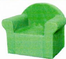
NS0596 Maxi fotel Olaf.