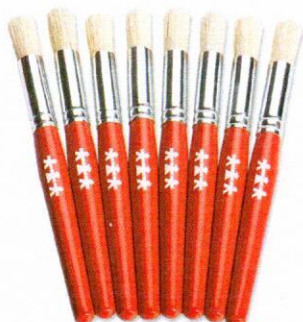
NS1039 Pędzle standard okrągłe 13mm 8szt