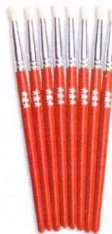
NS1036 Pędzle standard okrągłe 4mm 8szt