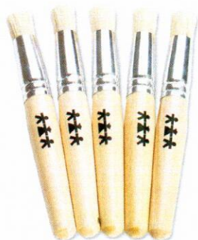
NS1047 Pędzle do tapowania 18mm 5szt