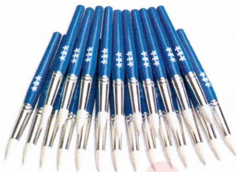
NS1051 Pędzle uniwersalne 24szt