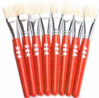
NS1043 Pędzle standard płaskie 20mm 8szt