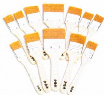
NS1055 Pędzle szerokie mix 12szt