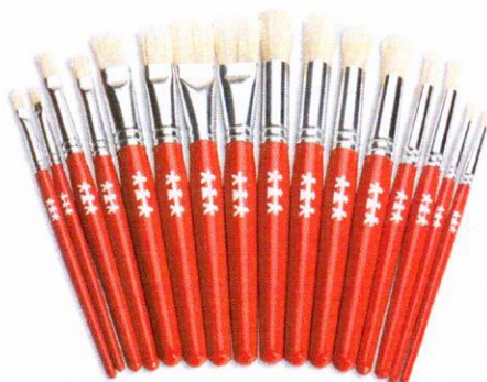
NS1035 Pędzle standard mix 24szt