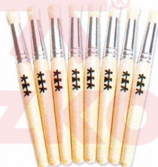
NS1046 Pędzle do tapowania 12mm 8szt