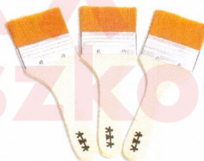
NS1054 Pędzle szerokie 60mm 3szt