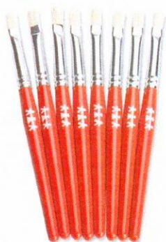
NS1041 Pędzle standard płaskie 9mm 8szt