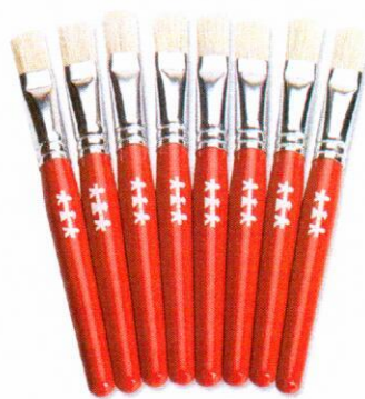
NS1042 Pędzle standard płaskie 15mm 8szt