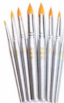
NS1044 Pędzle profesjonalne okrągłe mix 12szt