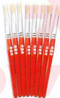
NS1037 Pędzle standard okrągłe 8mm 8szt