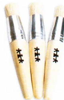
NS1048 Pędzle do tapowania 26mm 3szt