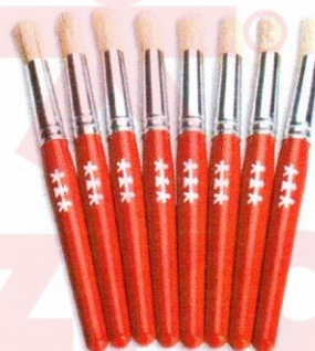
NS1038 Pędzle standard okrągłe 11mm 8szt