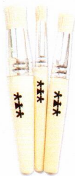
NS1049 Pędzle do tapowania mix 3szt