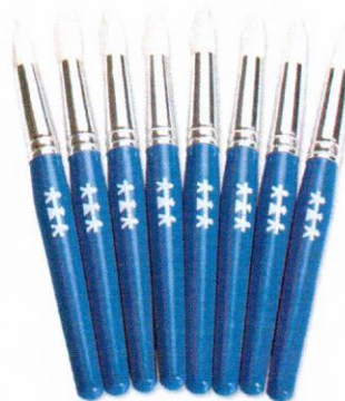
NS1050 Pędzle uniwersalne 8szt