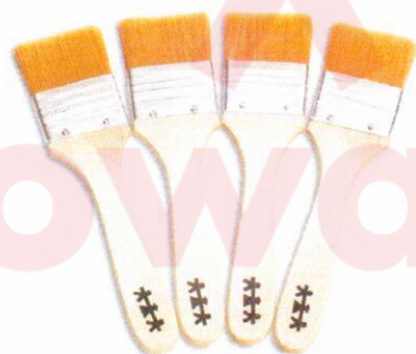
NS1053 Pędzle szerokie 40mm 4szt