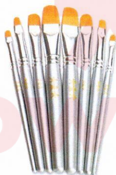
NS1045 Pędzle profesjonalne płaskie mix 12szt