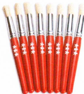
NS1078 Pędzle standard okrągłe 12 mm 8 szt