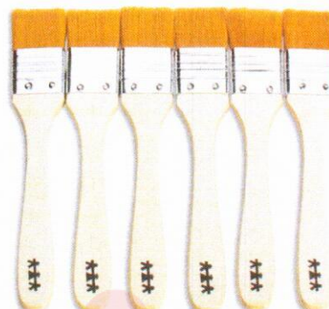
NS1052 Pędzle szerokie 24mm 6szt