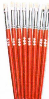
NS1040 Pędzle standard płaskie 5mm 8szt