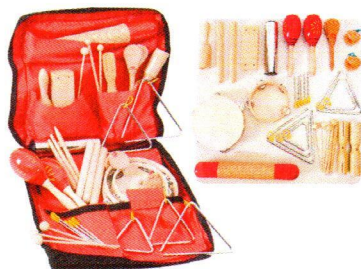
VO8319 Torba z instrumentami – zestaw perkusyjny.