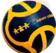
VO0011 piłka nożna uliczna 5