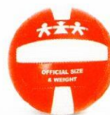
VO0003 piłka do siatkówki 5