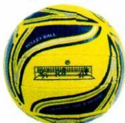
VO0032 piłka do siatkówki plażowej 5