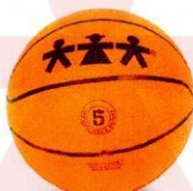
VO0005 piłka do koszykówki 5