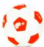
VO0001 piłka nożna 5