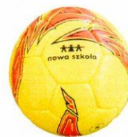
VO0037 piłka nożna 8