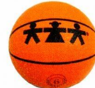
VO0034 piłka do koszykówki 6