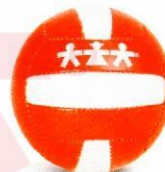
VO0006 piłka do mini-siatkówki 4