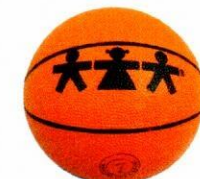
VO0033 piłka do koszykówki 7