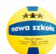
VO0031 piłka do siatkówki 5