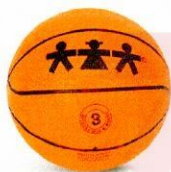
VO0004 piłka do koszykówki 3