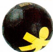
VO0029 piłka do ręcznej 2