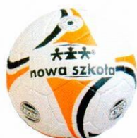
VO0035 piłka nożna 6