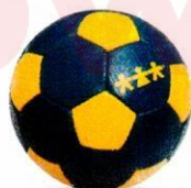
VO0009 piłka nożna uliczna 3