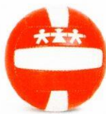
VO0002 piłka do siatkówki 1