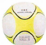
VO0038 piłka do ręcznej 2