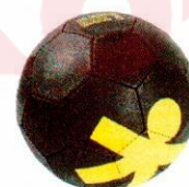
VO0028 piłka do ręcznej 1