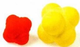
VO3548 Piłeczka sześcian