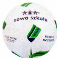
VO0036 piłka nożna 7