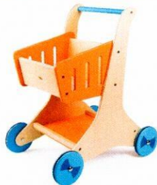
VG0672 Wózek sklepowy.