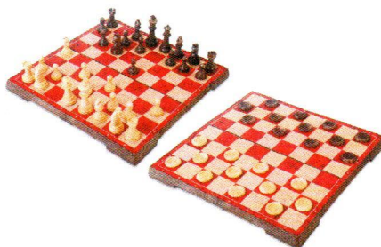
TF4856Szachy – Warcaby.