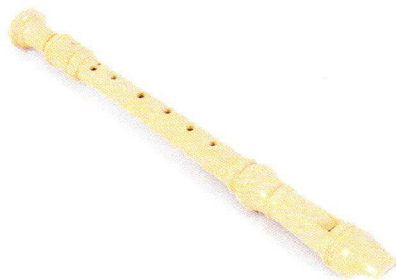
OV0100 Flet klasyczny.