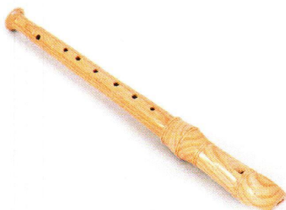
NT4250 Flet prosty.