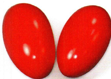
NT2201 Marakasy jajka.