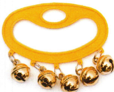
PG2720 - 5 janczarów z rączką.