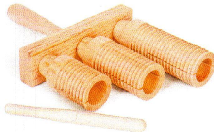
NT9005 Trzyczęściowe Guiro.