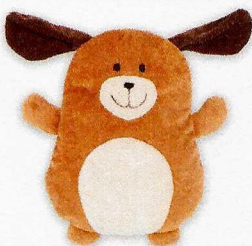
NS2074 Piesek. Miękka podusia.