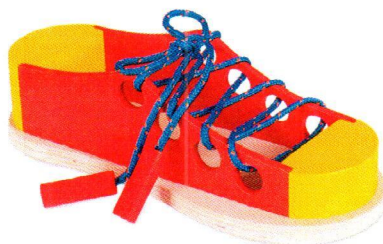
NS0357 Przewlekanka – Duży but.