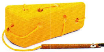
NS0352 Przewlekanka – Ser.