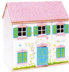
NS0199 Domek dla lalek z motylkami.