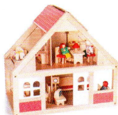
NS0198 Domek dla lalek z czerwoną dachówką.