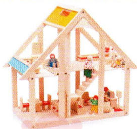
NS0197 Domek dla lalek z pomarańczową dachówką.