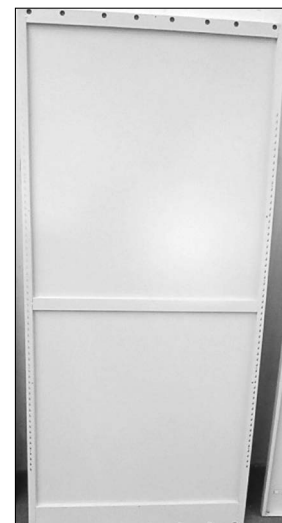
Tył – 1 szt. z trzema wzmocnieniami