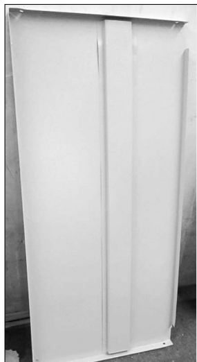
Góra i środek – 2 szt. z nacięciami