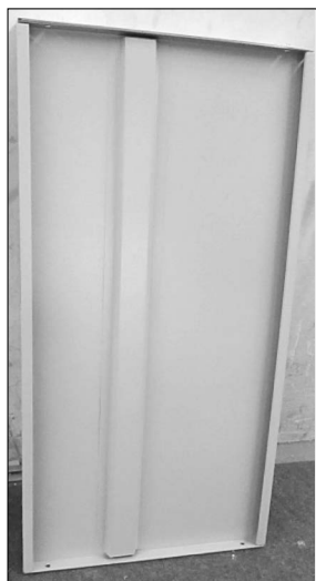
Półki – 3 szt.