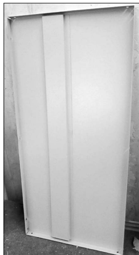
Wieniec górny szafy bez nacięcia z otworami do za- mocowania – 1 szt.