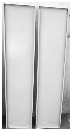
Boki – 2 szt. Lewy i prawy z nacięciami

Włóż podkładki na szuflady w pionowe nacięcia.