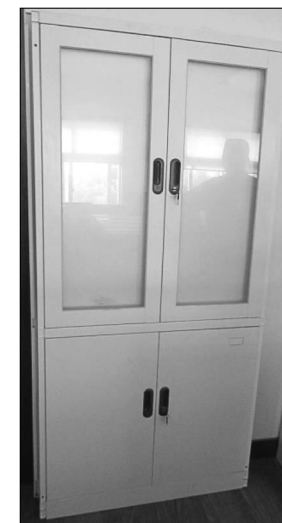
Drzwi z ościeżkami – 1 szt.