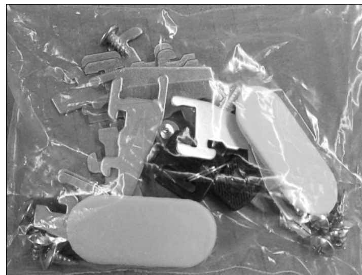
Osprzęt: śruby zakrętki itd.