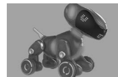
■ PYXEL – Robot z Wifi