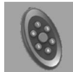
■ Aktywator Kodów