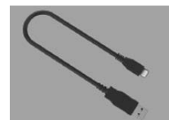
■ Kabel USB C