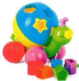
FT5025 Ślimak z bryłami.