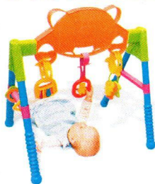
FT5216 Stojak z zabawkami.