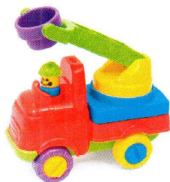
FT5054 Samochód strażacki.