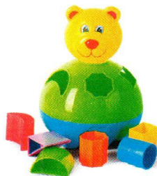
FT5094 Misio z bryłami.