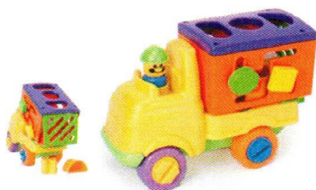
FT5055 Wywrotka z sorterem.