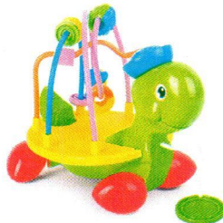
FT1064 Żółw z labiryntem.