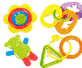
FT5057 Zestaw grzechotek.