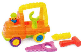
FT5053 Samochód mały mechanicz.