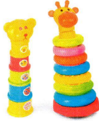
FT5204 Zestaw piramidek..