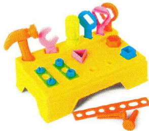
FT5098 Stolik z narzędziami.