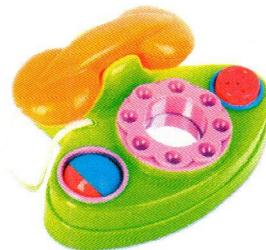
FT5048 Kolorowy telefon.