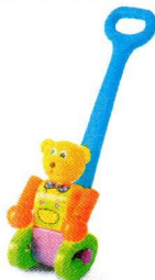
FT5207 Miś na kiju.