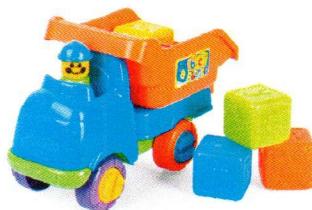
FT5330 Samochód Wywrotka.