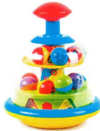
FT5004 Obrotowy bączek.