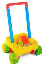
FT5061 Wózek z klockami.