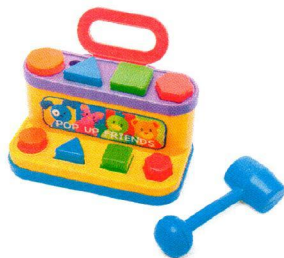
FT5009 Sorter Przyjaciele.