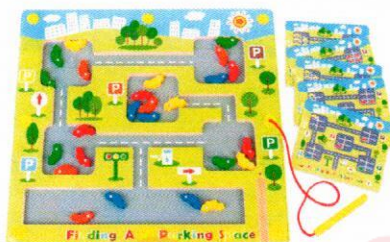
EO1407 Parking – magnetyczny labirynt.