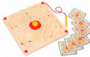
EO0517 Labirynt wzory.