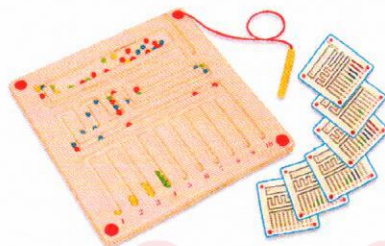
EO5229 Labirynt matematyczny.