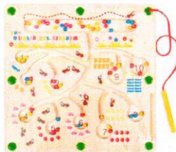
EO1113 Labirynt mrówki matematyczne.