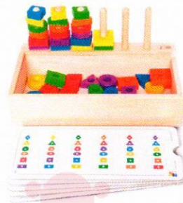
EO1204 Geometryczne rytmy. Gra edukacyjna.