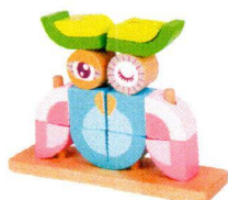
CI3708 Piramidka Sowa.