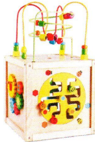
CI0740 Sześcián manipulacyjny duży.