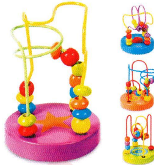
CI0097 Labirynt mini.