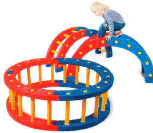
BY2209 Drabinki półokrągłe.