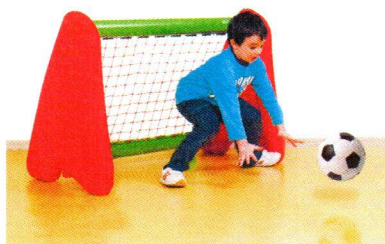
BY4000 Bramka pomarańczowa.