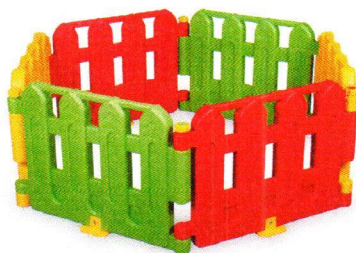
BY9010 Kolorowy płotek.