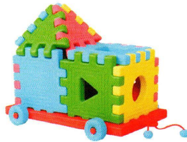
BY5011 Komplet dużych klocków z wózkiem.