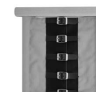
A00012 ze sprzączkami