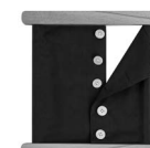
A00010 z dużymi guzikami