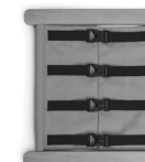
A01148 z zatrzaskami