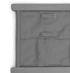
A01149 z rzepami