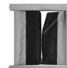
A00011 z zamkiem błyskawicznym