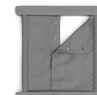
A01142 z napami