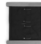
A01147 z agrafkami