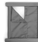
A01145 z ukrytymi zapięciami