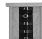
A00012 ze sprzączkami