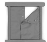
A01142 z napami