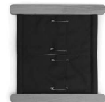
A01147 z agrafkami