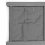
A01149 z rzepami